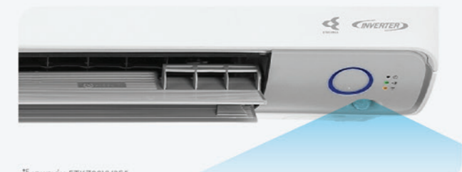
* IDP รุ่น FTKZ09YV2S5

ฟังก์ชันเพื่อการประหยัดพลังงาน เมื่อเซนเซอร์ไม่พบการเคลื่อนไหวของบุคคลใน 20 นาที จะปรับเข้าสู่โหมดประหยัดพลังงานอัตโนมัติ